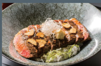
ステーキ丼 1,100円 (税込)