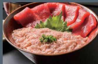
マグロ丼 1,300円 (税込)