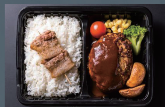
余市産麦豚ハンバーグ弁当 (180g) 1,280円 (税込)