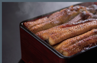
特上うな重 (1尾) / うな重 (半身) 3,200円 / 1,800円 (税込)