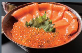
サーモン親子丼 1,300円 (税込)