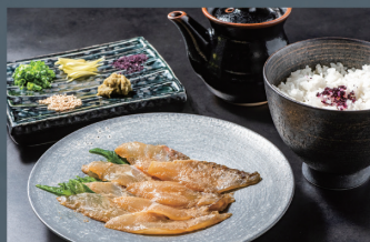
真鯛のひつまぶし 1,000円 (税込)