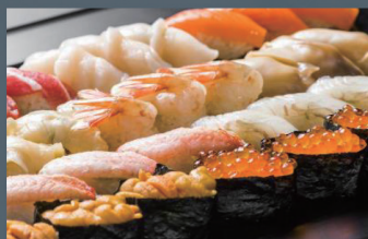
色内 (10貫) 3,300円 (税込)