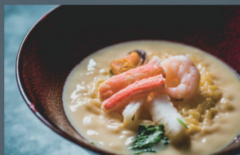
海鮮五目茶碗蒸し 850円 (税込)