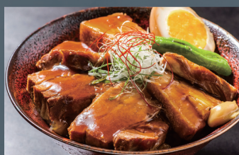
豚角煮丼 800円 (税込)