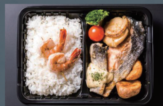
炙り海鮮バター醤油弁当 1,280円 (税込)