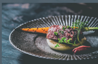
道産牛フィレ肉炙り 1,250円 (税込)