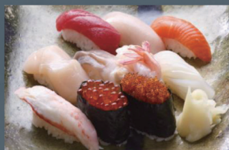
稲穂 (10貫) 2,200円 (税込)