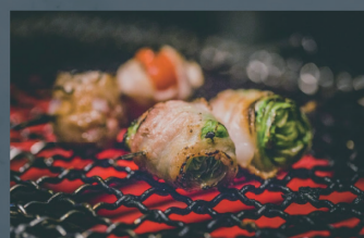
余市産麦豚じゃがいもロール レタスロール、トマトロール 各300円 (税込)