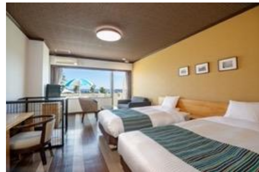
ペットルームオーシャンテラス付きデラックスツイン