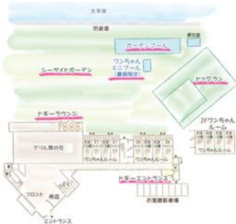
白浜オーシャンリゾート 全体図

白浜オーシャンリゾートは、全室が太平洋を 180°見渡すオーシャンビュー。ワンちゃんと泊まれるお部屋は、すべて専用のエントランスからシーサイドガーデンに出ることができ、ワンちゃん用アメニティも完備。客室は足洗い場付きのオーシャンテラス付きや展望風呂付きもあります。レストランにはワンちゃんと一緒にお食事ができるオープンテラス席もご用意。太平洋を真横に眺める芝生のドッグランには、ワンちゃんが大好きなアジリティを設置。潮風を感じながら、ノーリードでのびのびと走り回れます。ドッグランは朝 9 時から夜 9 時（ナイター照明有）までオープンしており、チェックイン前、チェックアウト後のご利用も可能です。