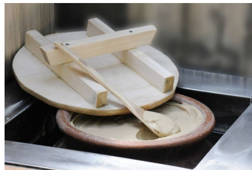
画像左から：森林露天風呂「霧乃湯」、温泉泥パック