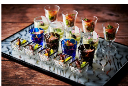
見た目も華やかなオードブル