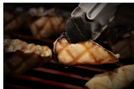
目の前で焼き上げる旬魚