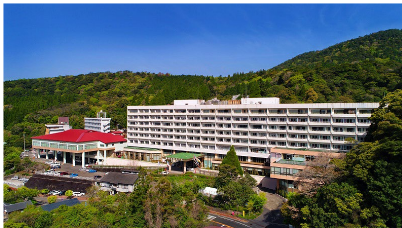
霧島国際ホテル（外観）

【運営会社】株式会社マイステイズ・ホテル・マネジメント （東京都港区六本木6-2-31六本木ヒルズノースタワー14階）