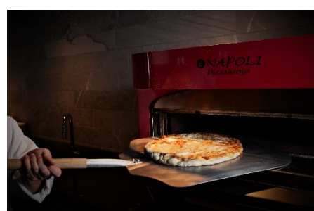
焼きたて石窯ピッツァ