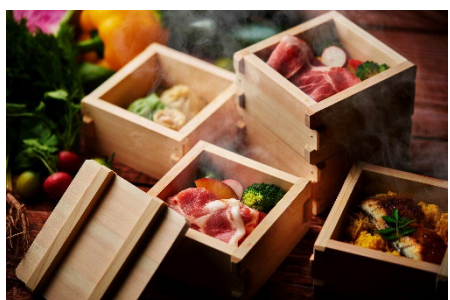
黒豚と地元野菜の湯けむり蒸し