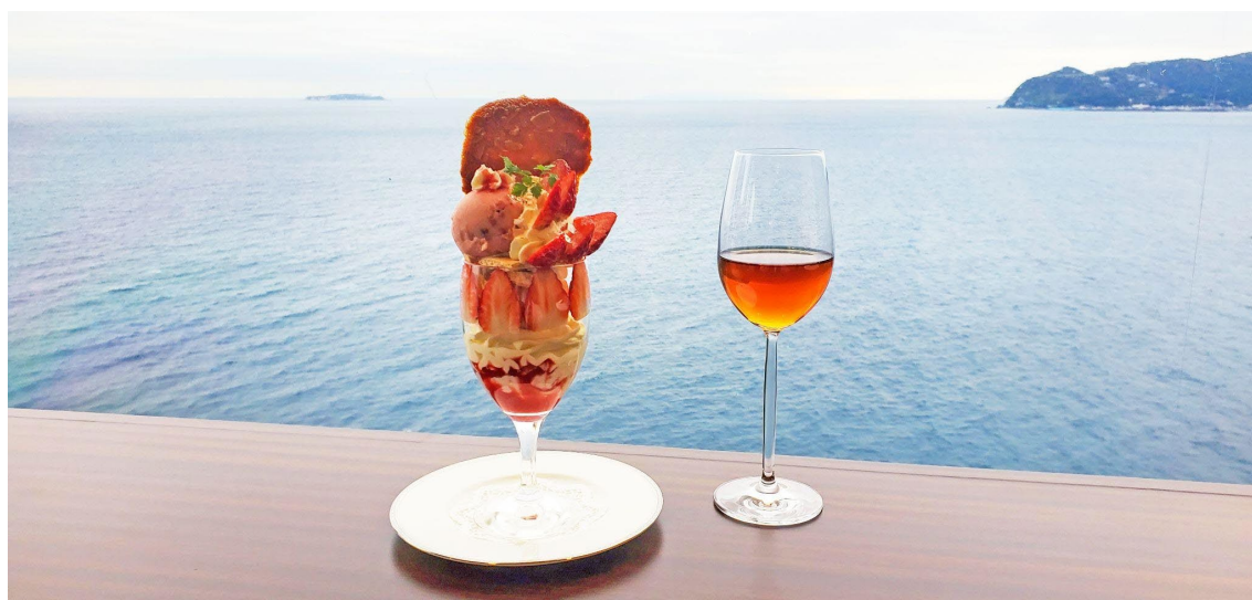
旬のいちごをふんだんに使った9層仕立ての「いちごのパフェ」とペアリングドリンク

ホテルニューアカオは、伊豆随一の絶景と謳われるカフェ「Restaurant & Sweets 花の妖精」にて、2022年12月24日（土）～2023年4月16日（日）まで「いちごのパフェ」を販売いたします。