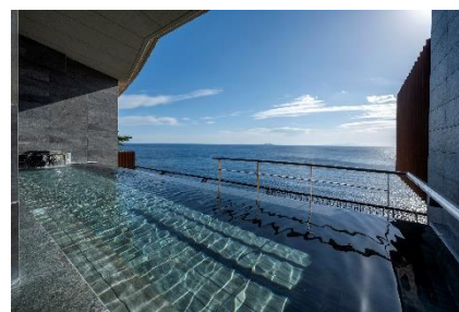
スパリウムニシキ