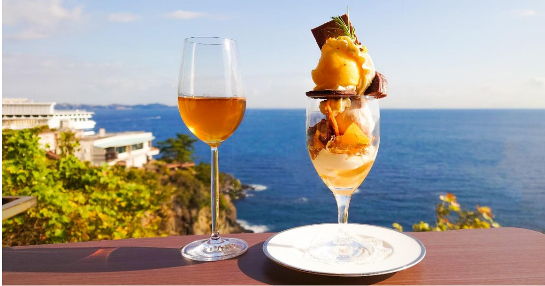
「柑橘とカカオのパフェ」とペアリングドリンク

ホテルニューアカオは、伊豆随一の絶景と謳われるカフェ「Restaurant & Sweets 花の妖精」にて、2023年1月28日（土）～2月19日（日）まで「柑橘とカカオのパフェ」を販売いたします。