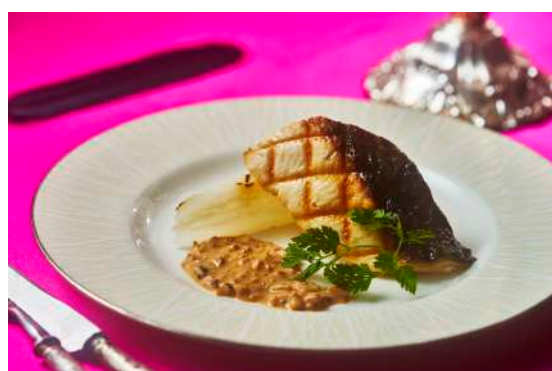
写真左から、「ローストビーフ 数種のベリーソース」、「ホワイトキングサーモンのグリル」