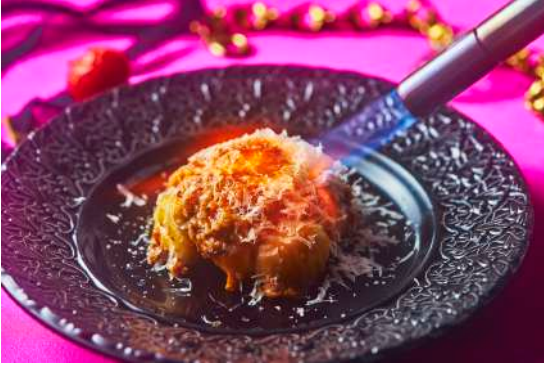
「ラグーソースのニューヨークグラタン風」

※食材を最高の状態で提供するため、当日の状態、仕入れ状況により内容が変更となる場合がございます。 ※画像はすべてイメージです。