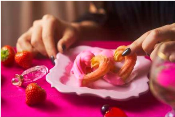
「HEART OF LILITH」